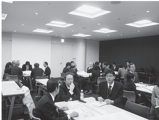
グループ・ディスカッションの様子