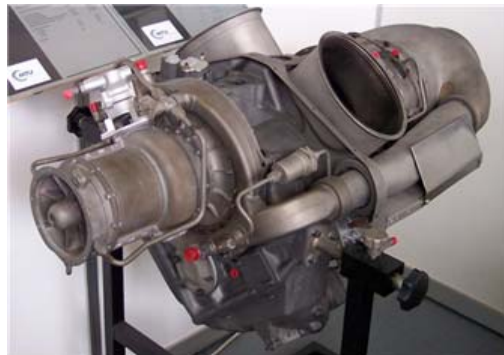
ロールスロイス製 ターボシャフトエンジン ( Rolls Royce turbo shaft engine )