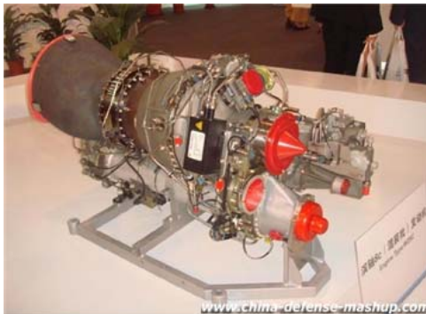
中国製ターボシャフトエンジン ( Chinese-made turbo shaft engine )