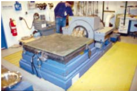
加振機付きの振動試験装置 ( Shaker unit in horizontal position )