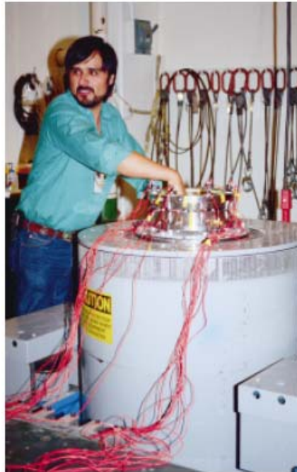
垂直加振機付きの振動試験装置 ( Vibration test equipment with shaker in the upright position )