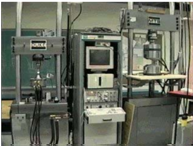
振動試験用ソフトウェアを組み込んだ制御装置 ( Digital control units, combined with "software" specially designed for vibration testing )