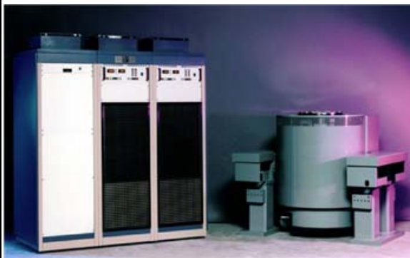
振動試験システム